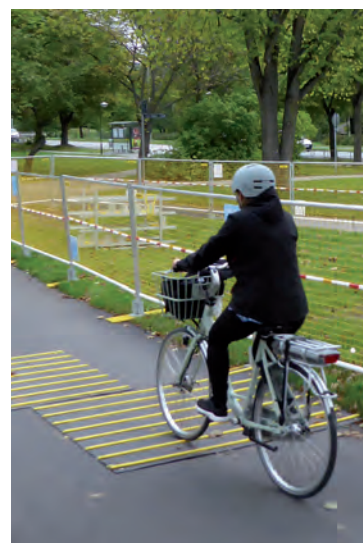
Exempel från provområden i Stockholm med nya typer av skydd för t ex cyklister.

I samband med mässan planeras det även kringarrangemang, t ex i form av utbildningserbudanden som man kan dra nytta av när man ändå är på plats. Allt med syftet att skapa en säkrare trafikmiljö för trafikanterna och alla som har vägen som arbetsplats.